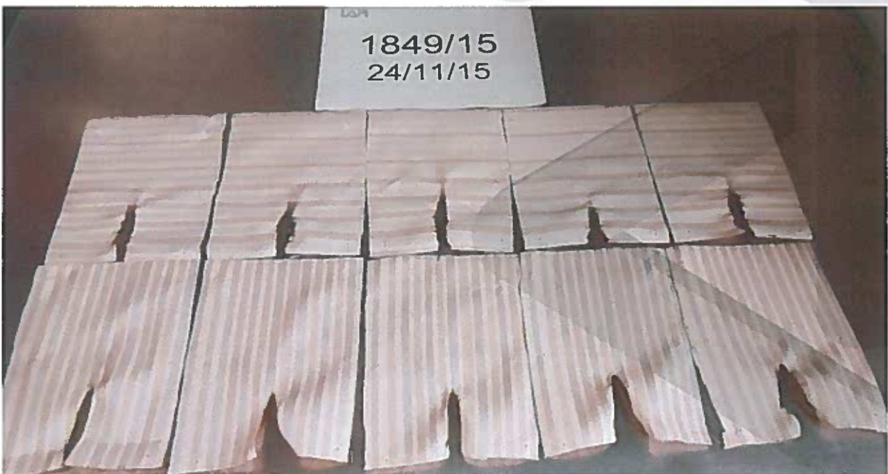
Foto 4: dopo la prova, lato rovescio / Picture 4: after testing, back side

LUOGO E DATA PROVA: Prato 24/11/2015 Place and test date