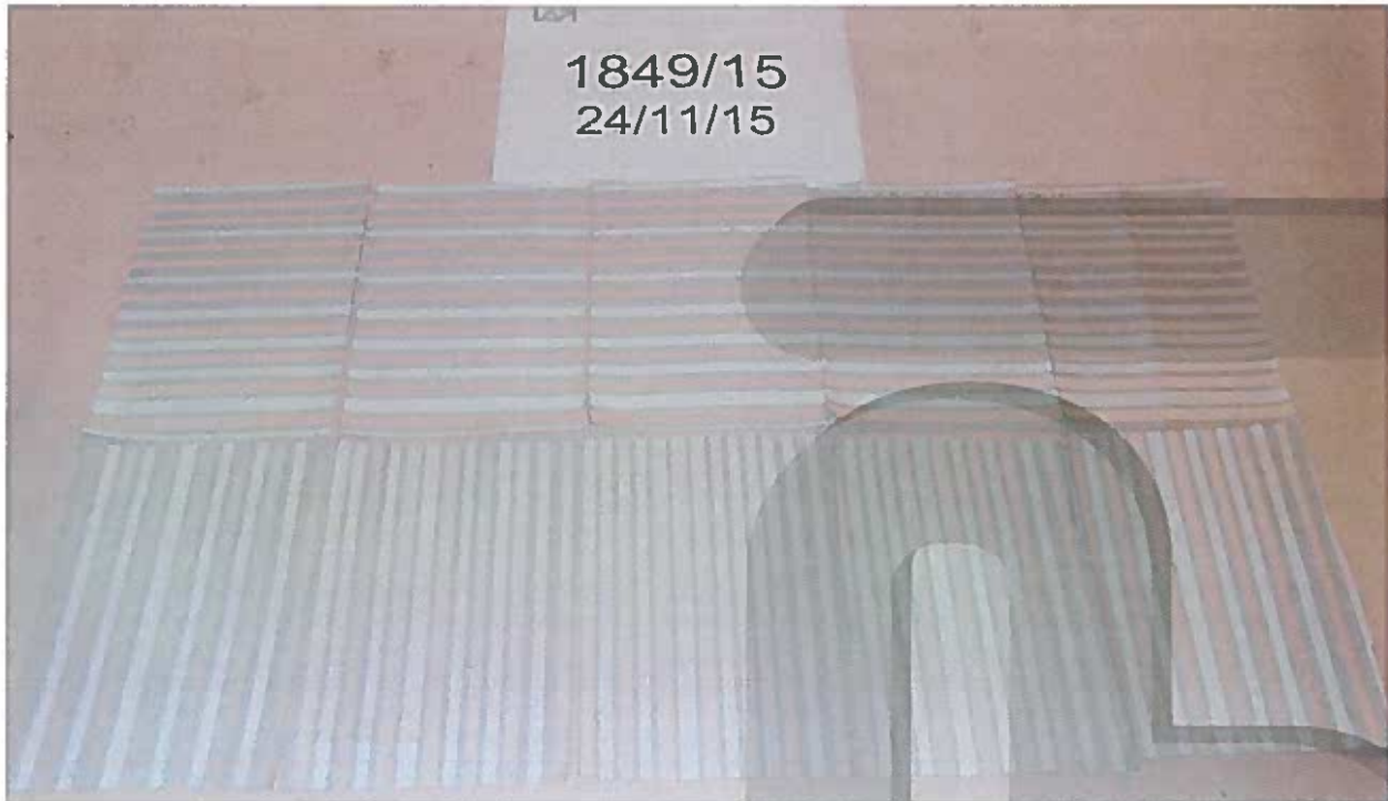
Foto 1: prima della prova, lato diritto / Picture 1: before testing, right side