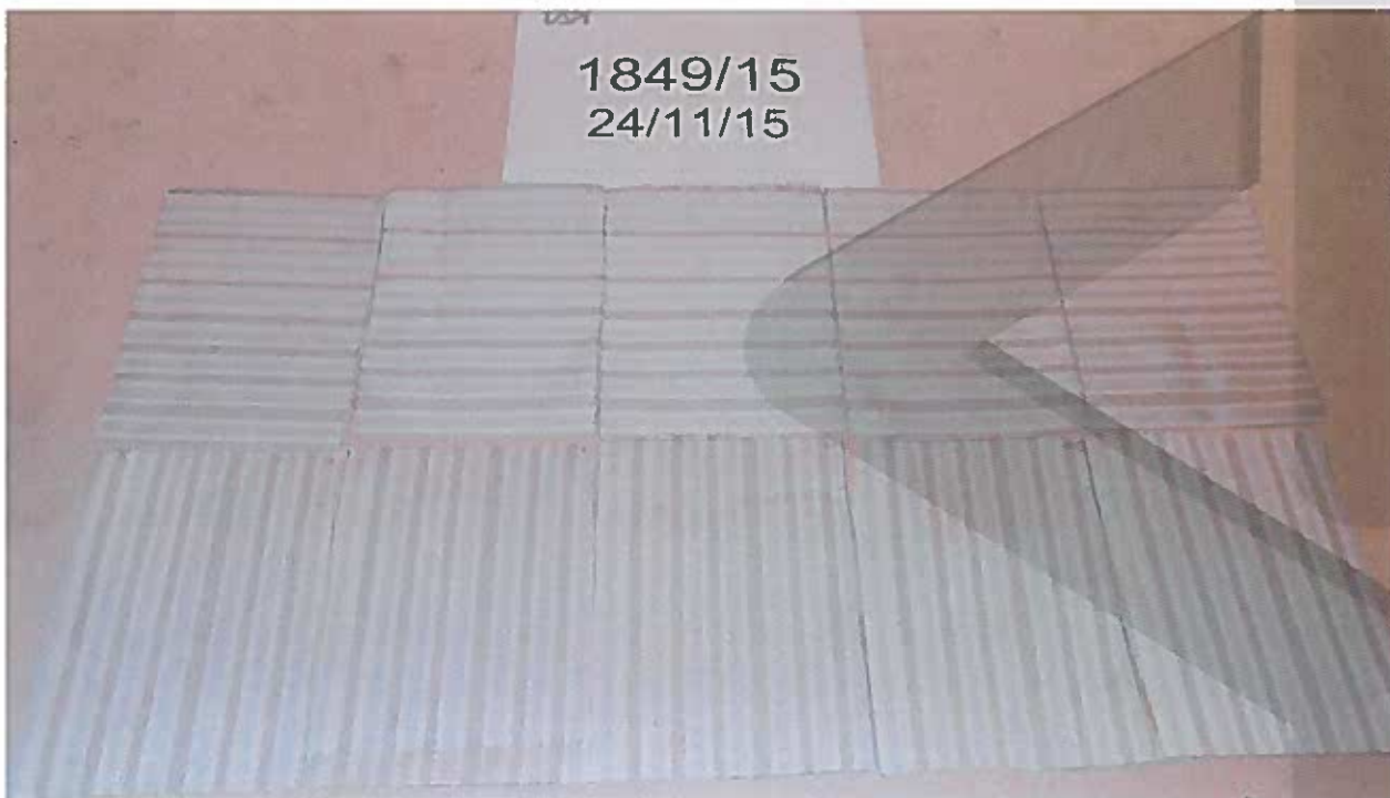
Foto 2: prima della prova, lato rovescio / Picture 2: before testing, back side

LUOGO E DATA PROVA: Prato 24/11/2015 Place and test date