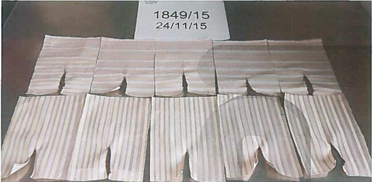
Foto 3: dopo la prova, lato diritto / Picture 3: after testing, right side